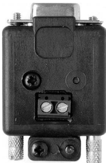
CONVERTISSEUR ISOLATEUR NMEA/RS232