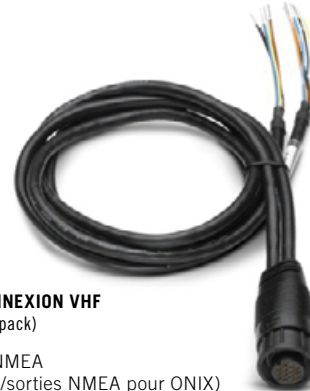
CÂBLE POUR CONNEXION VHF (non fourni dans le pack)

>réf. AS-DUALNMEA (Câble 2 entrées/sorties NMEA pour ONIX)